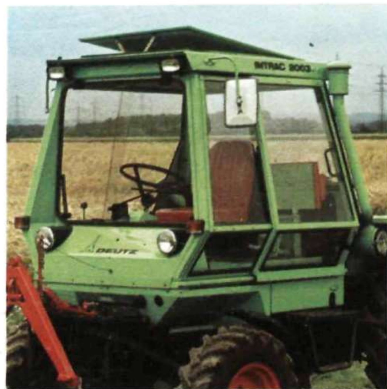
Ideale Sicht nach allen Seiten