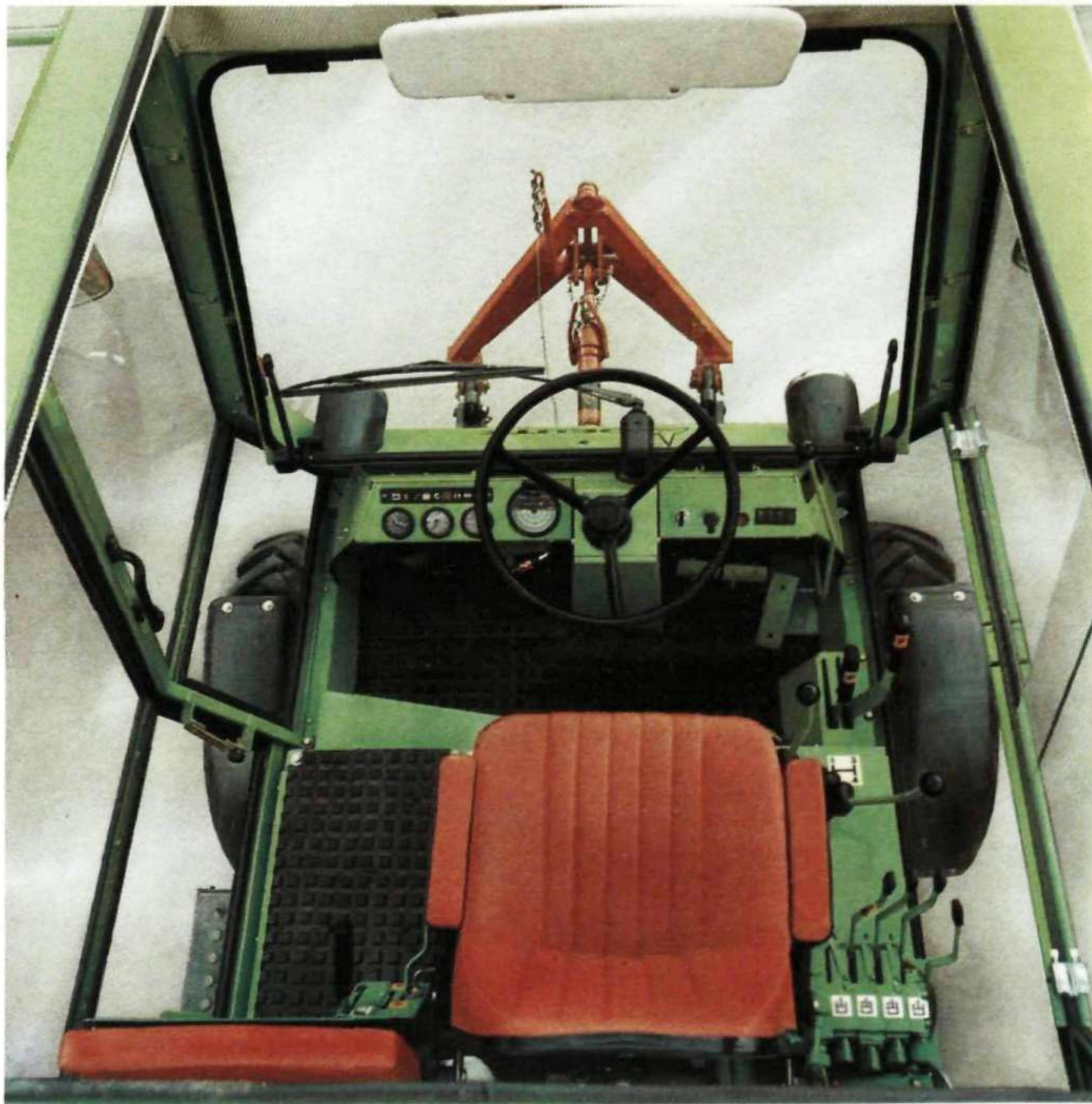
Arbeitsplatz mit PKW-Komfort

Hervorragend die Rundumsicht: Direkter Blick auf breite Frontgeräte. Großzügig die Belüftungsmöglichkeiten. Das starke Frischluftgebläse und die Motorwarmluftheizung sorgen für weitere Annehmlichkeiten an heißen bzw. an kalten Tagen.