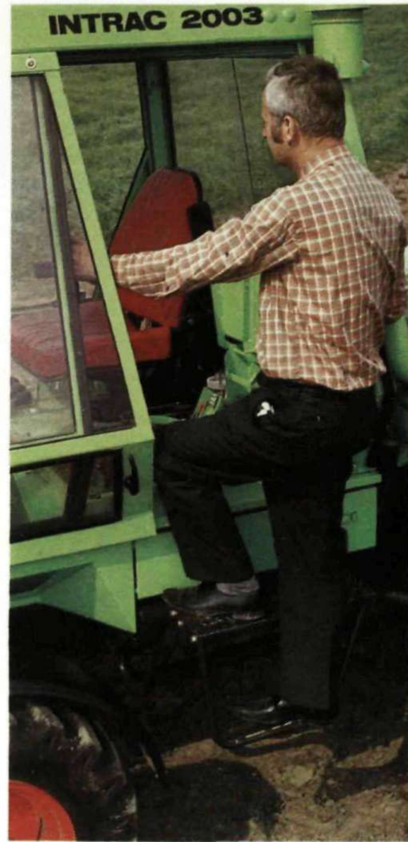
Bequemes Ein- und Aussteigen auch in engen Einfahrten oder Garagen.