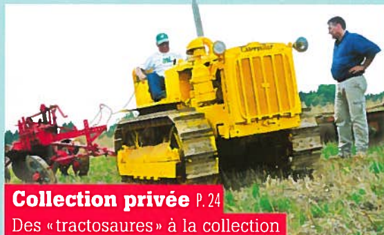
P. 24 Des «tractosaures» à la collection

Tractorama 44 - février - mars 2014 - France 5,95 € - Belgique 6,55 € - Suisse 11,80 CHF - Luxembourg 6,50 € - Canada 10 $can