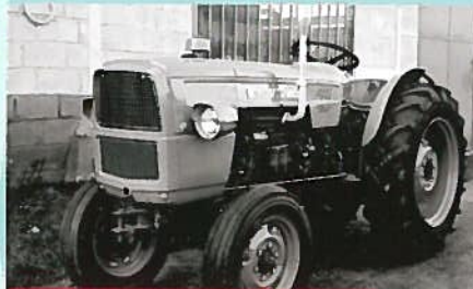
Archives inédites P. 6 Someca série 15