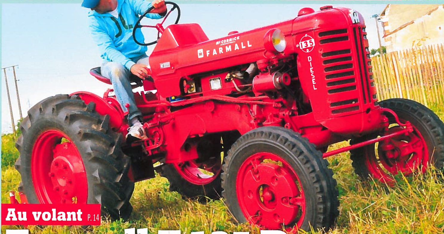
Au volant P. 14

Tractorama 44 - février - mars 2014 - France 5,95 € - Belgique 6,55 € - Suisse 11,80 CHF - Luxembourg 6,50 € - Canada 10 $can