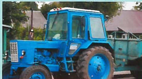
Mon tracteur, ma passion P. 64 Voyage dans les Pays Baltes