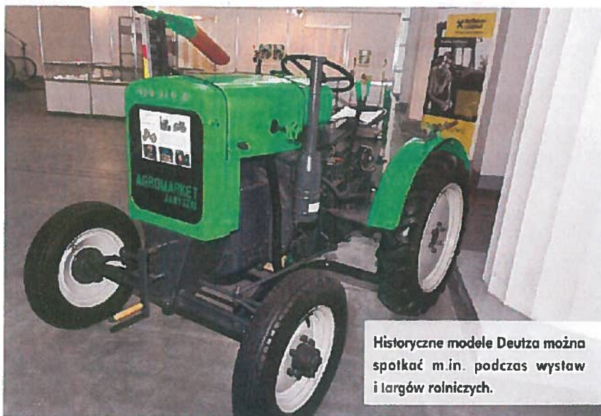
Historyczne modele Deutza można spotkać m.in. podczas wystaw i targów rolniczych.